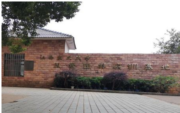
实训基地外部照片

【教学条件】 学科构建了国家级线上课程、省级研究生案例课程等组成的优质课程体系，拥有江西乡村文化发展研究中心、国家林草局重点实验室、自然资源部高层次科技创新人才工程(国土空间规划行业)科技创新团队、江西省研究生创新基地等省部级科研平台。学科践行“产、学、研、用”相结合的人才培养模式，形成“校外实践基地+校内科研平台+项目合作基地”实践教学基地体系，建成了 38 个校内外实践教学基地。