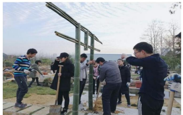
实训基地实训教学照片