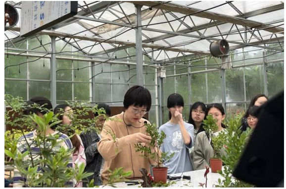
花卉盆景基地实训教学照片

【科教成果】 近年来，学科教师共主持国家级项目 20 余项（其中国家自然科学基金 17 项）、省部级科研项目 50 余项、市厅级科研项目 30 余项，纵向科研经费达 2000 万元；主持横向科研项目 20 余项，科研经费达 600 余万元。以第一作者或者通讯作者发表高质量学术论文 200 余篇，其中 SCI 论文 50 余篇；主编出版学术专著 15 部。研究成果获省部级科研奖励 6 项，市厅级科研奖励 10 余项。获批国家级一流课程 2 门、省级一流课程 8 门，获省级教学成果奖 6 项，主编出版教材 15 部，主持省级以上教育教学项目 16 项。