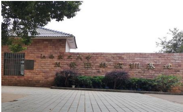
风景园林实训基地外部照片

【教学条件】 学科构建了国家级线上课程、省级研究生案例课程等组成的优质课程体系，拥有江西乡村文化发展研究中心、国家林草局重点实验室、江西省研究生创新基地等省部级科研平台。学科践行“产、学、研、用”相结合的人才培养模式，形成“校外实践基地+校内科研平台+项目合作基地”实践教学基地体系，建成了包括全国示范性风景园林专业学位研究生联合培养基地在内的 38 个校内外实践教学基地。