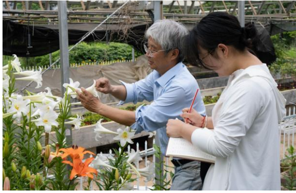
导师指导科研工作照片