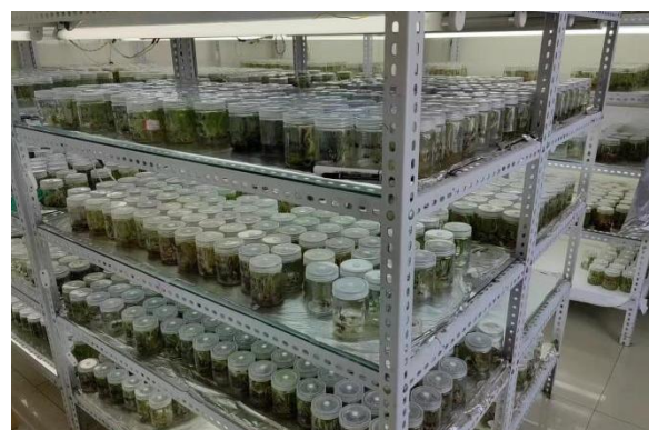
园林植物科研实验室