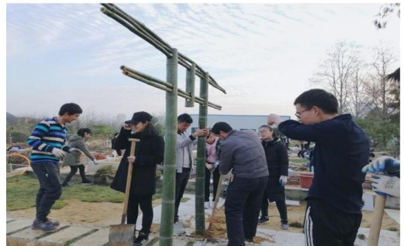
风景园林实训基地实训教学照片