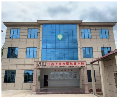
上高水稻科技小院