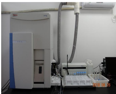
电感耦合等离子体质谱仪